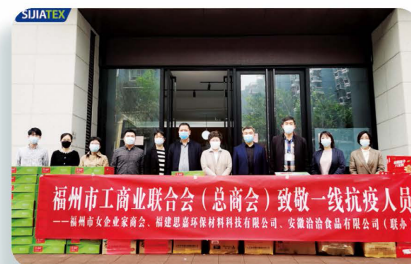
為福州市防疫一線工作者捐贈物資

集團未來將繼續通過其他方式回饋社會，並將持續關注社區的經濟和文化發展，積極履行良好企業的公民責任，為社會帶來正面影響。