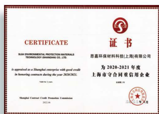
上海市守合同重信用企業