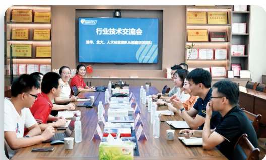
行業技術交流會 清華大學、北京大學、人大研發團隊及 思嘉研發團隊

另外，本集團透過不同的獎勵形式，例如考試假期、現金補貼等，支持員工參加由專業機構舉辦的座談會、分享會、以及相關課程，積極鼓勵員工持續學習與進修來增加職業技能和競爭力。