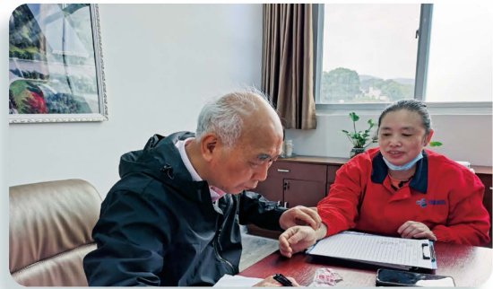
健康顧問為員工問診