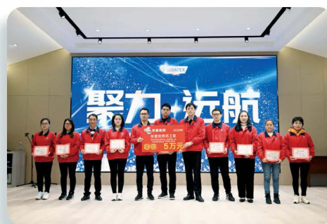
年度優秀員工表彰