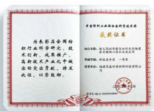
中國紡織工業聯合會 科學技術獎 科技進步獎一等獎