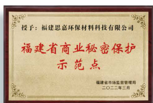
福建省商業秘密保護示範點