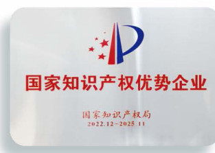
國家知識產權優勢企業